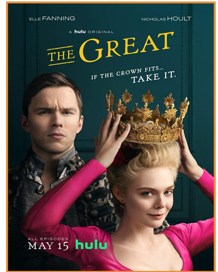
The Great (2020-)