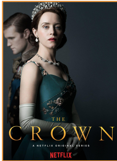
The Crown (2016-)