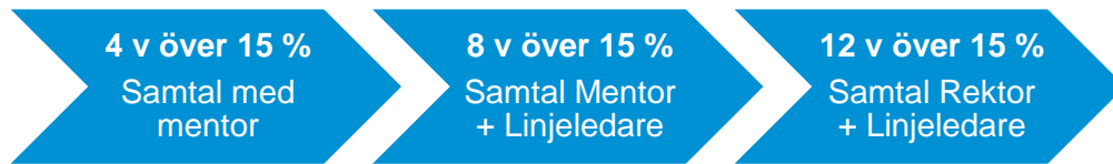
Figur 3: Process för uppföljning av frånvaro.

gång till samtal med rektor. Om deltagaren inte kommer till detta samtal tolkar skolan det som att deltagaren vill avsluta sina studier.