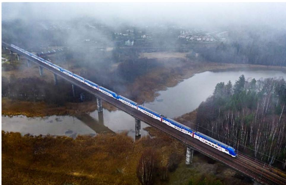
EKIPAGET PÅ BILDEN ÄR 420 METER LÅNGT, VÄGER NÄSTAN 1 000 TON OCH KAN TA EMOT 1 428 SITTANDE RESENÄRER.

Efterfrågan på tåglägen är generellt högre än vad spårkapaciteten på många banor medger och utbyggnadstakten går för långsamt i relation till behov. Konflikterna mellan olika aktörers tåglägen förväntas öka och det finns behov av att förändra regelverket så att pendlingstrafiken prioriteras högre, för att möta efterfrågan av dagliga resor för arbete och studier samt näringslivets behov.