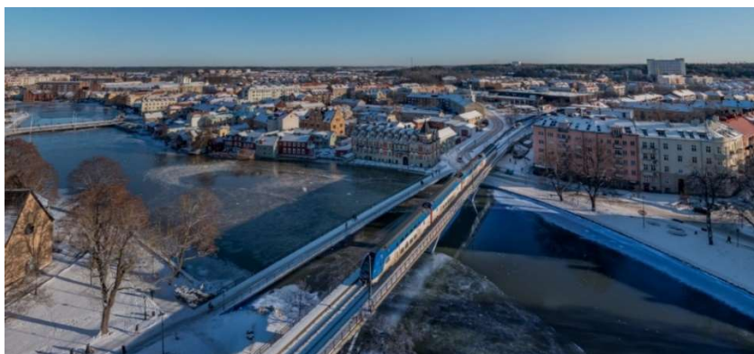
ETT MÄLARTÅG RULLAR IN MOT ESKILSTUNA DÄR FORDONSDEPÅN ÄR PLACERAD.

Gredbydepån i Eskilstuna, där fordonen underhålls, har varit i drift sedan februari 2019. Under 2021 har ett nytt hyresavtal beretts tillsammans med Eskilstuna kommun som äger fastigheten och kommer att tecknas under våren 2022. Under året har depån förberetts för att MTR Mälartåg AB utöver ER1 fordonen ska kunna göra underhåll av Regina X50 fordonen. Även ett stort arbete under 2021 har varit att tillsammans med SJ AB:s underleverantör Mantena AB förbereda avslutet på övergångsavtalet.