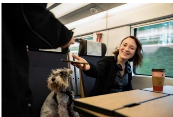
VISERING OMBORD PÅ MÄLARTÅG (ER1).

Mälartåg enkel är Mälardalstrafiks enkelbiljett för resor på Mälartåg.