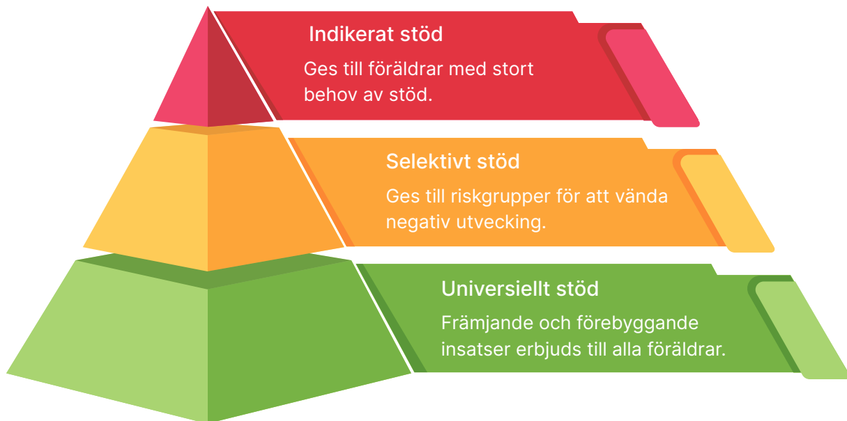
Figur 1 Preventionspyramiden

Föräldraskapsstöd stärker skyddsfaktorer som kompenserar för många olika riskfaktorer och är därför effektivt för att påverka olika typer av problematik. Föräldraskapsstöd ska erbjudas på fler arenor, nå alla grupper av föräldrar samt erbjudas på de tre preventionsnivåerna, universell, selektiv och indikerad nivå, se figur 1.