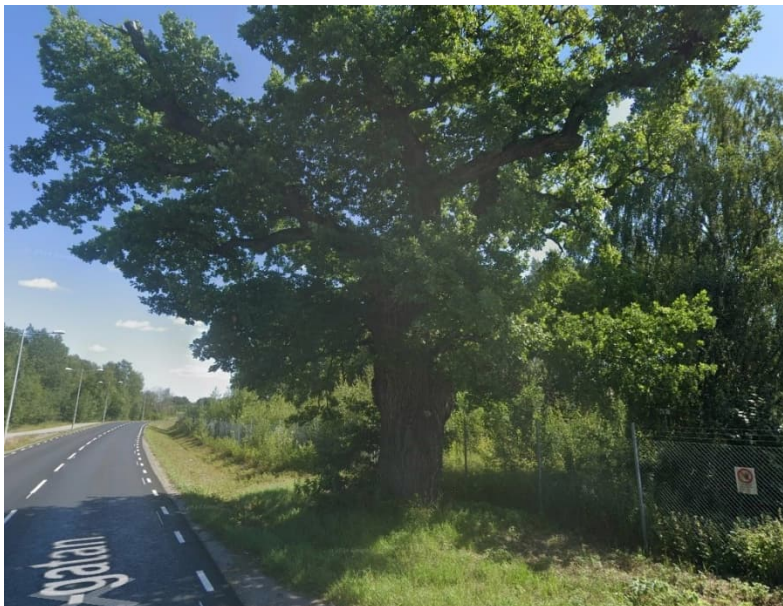
Figur 2. Fotot visar den skyddsvärda eken.

Eken står utanför ett instängslat område på en grönyta mellan stängsel och CV-gatan (Figur 2).