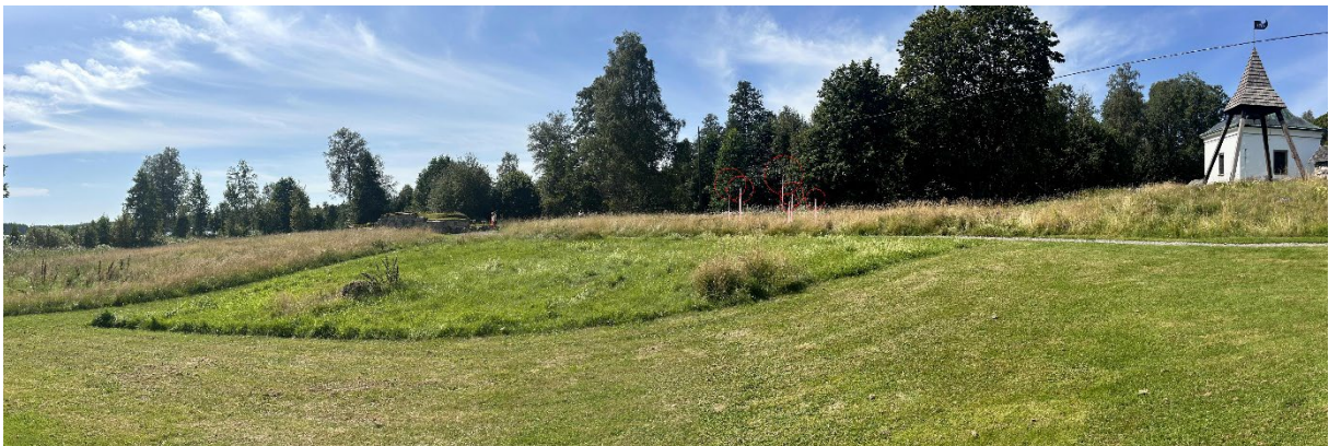
Figur 3. Fotomontage från Ramundeboda klosterruin. Röd cirkel är infogad för tydlighet.