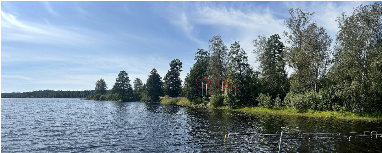
Figur 2. Fotomontage från Borasjöns badplats (brygga). Röd cirkel är infogad för tydlighet.