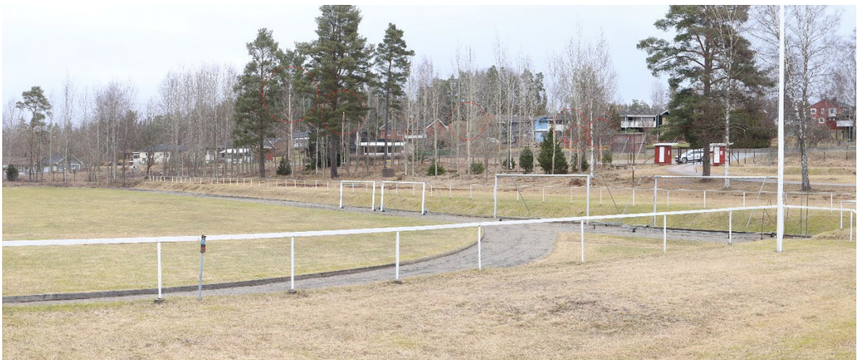
Figur 4. Fotomontage från Finnerödja Idrottsplats. Röd cirkel är infogad för tydlighet.