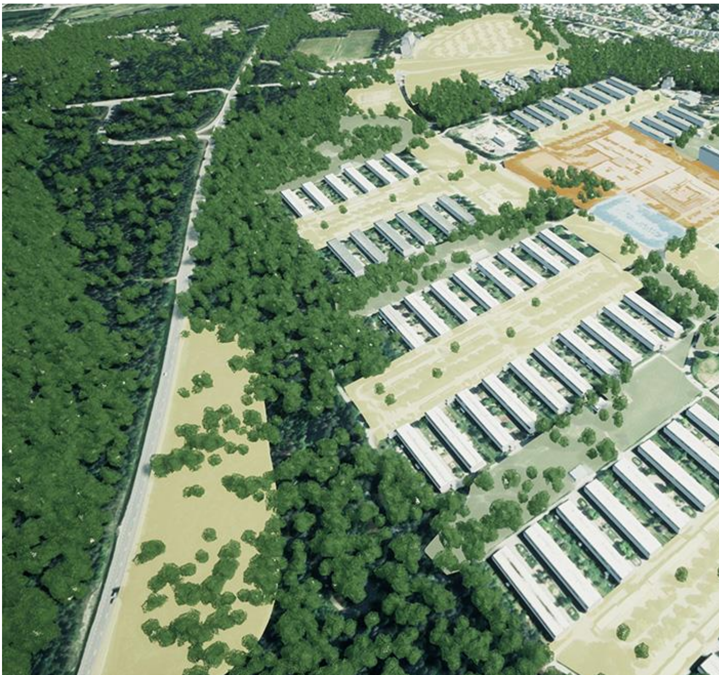
Vy från sydväst. Illustration: Örebro kommun.