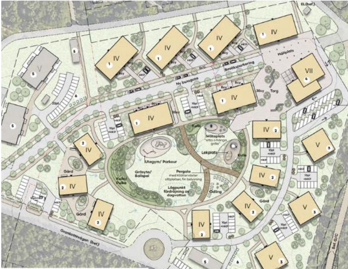
Figur 2. Plankarta

Den plankarta som legat till grund för utredningen presenteras i figur 2. I området planeras flerbostadshus i 4- 5 våningar. De bostadshus som ligger närmast bussgatan planeras bli studentbostäder (sex flerbostadshus markerade med "1" i figur 2). Det planeras även en ny bussgata genom områdets norra del.