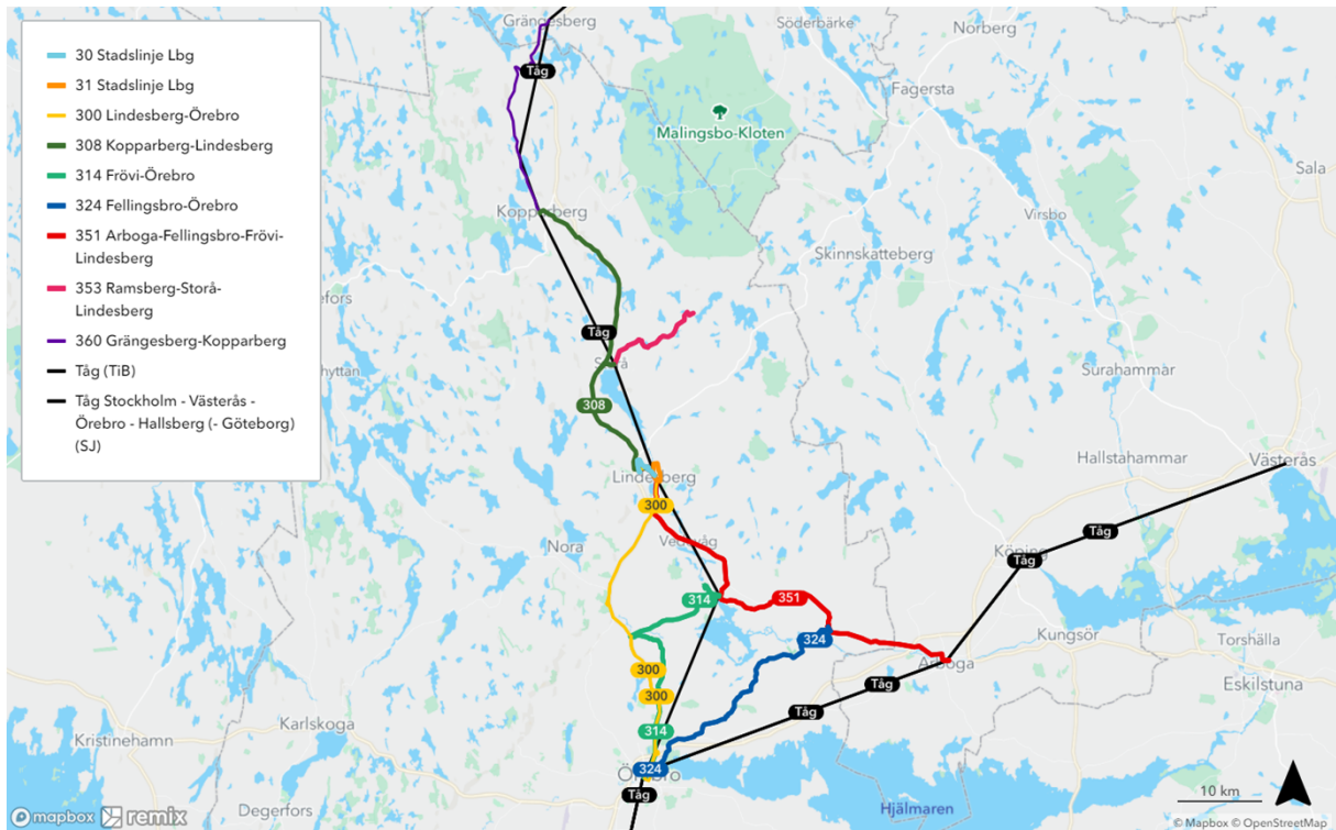
Figur 1. Tåg och bussars ungefärliga linjesträckningar i stråket.